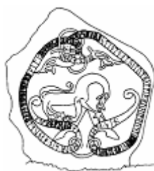
Figur 1. Sö213.

Södermanlands runstenar hamnade under min lupp i en kvantitativ undersökning, med syftet att utröna om det var möjligt att nytolka runstenarna genom att kombinera runstenarnas text, bild och miljö. Jag analyserade de olika delarna av runtexten och satte dessa i förhållande till själva runslingan.